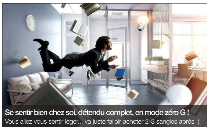
Se sentir bien chez soi, détendu complet, en mode zéro G ! Vous allez vous sentir léger... va juste falloir acheter 2-3 sangles après ;)

Un magnifique carton chatertoné dans un coin du salon qui n'a même pas été ouvert suite à ton dernier déménagement et qui te sert parfois de table basse d'appoint pour les apéros improvisés... pratique !